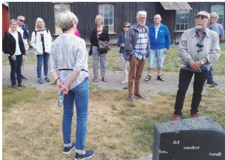
Noen av oss 13 fra seniorgruppene i FO/Buskerud og FO/Vestfold