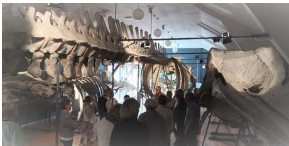
Visste du at blåhvalen kan bli 27 meter lang? Bildet viser seniorgruppa i Hvalhall.

Klikk her (PPTX, 194KB) for Harald Baardseths PowerPoint-presentasjon: